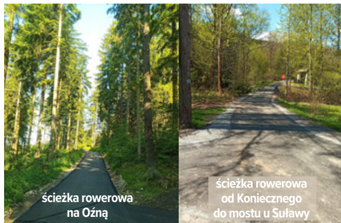
ścieżka rowerowa na Ożną

Całkowita wartość inwestycji po stronie Gminy Rajcza wyniosła 1.565.237,53 zł.